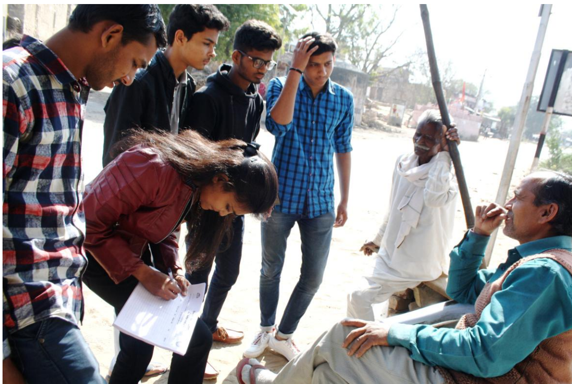
4.2 B Girl Volunteers during Registration for Eye Camp