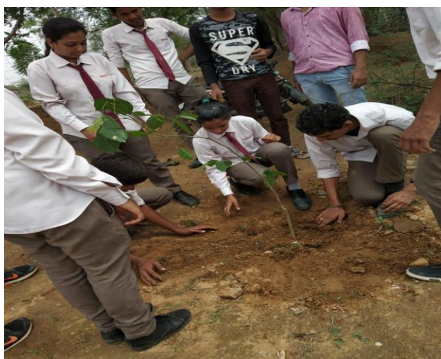
4 (C) Plantation by Students