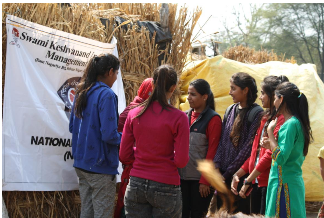
4.6 C Awareness of Health and Hygiene for Women