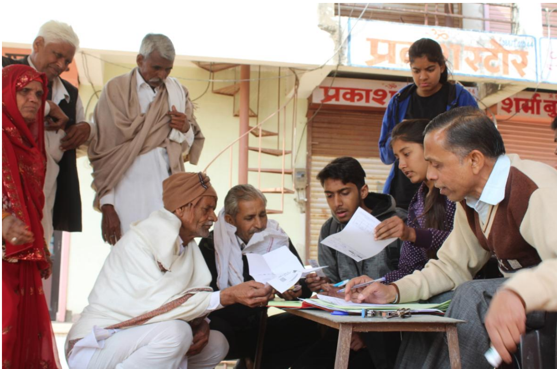
4.5.C Eye Camp Registration process by Volunteers