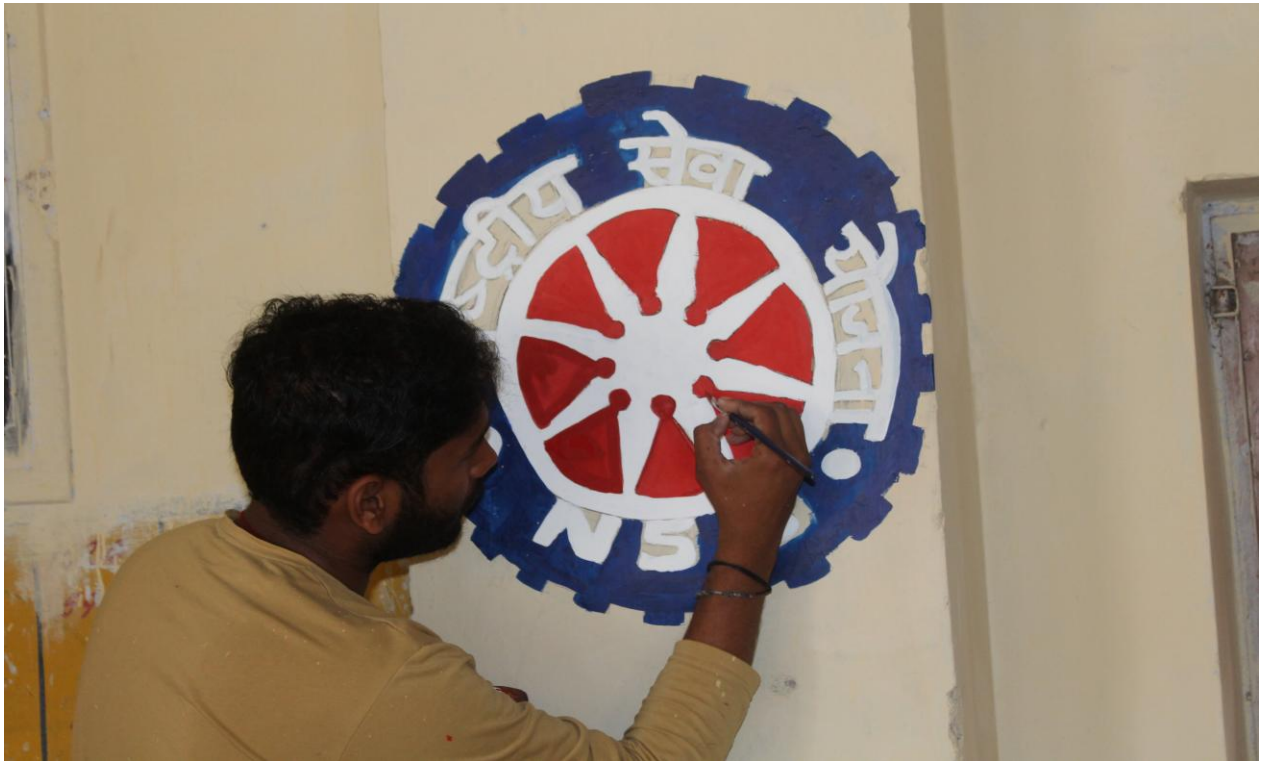
4.4D Making Logo of NSS on the wall of Yatri Vishram Grah