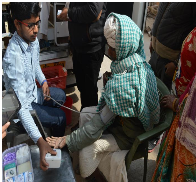
7(C). Free Medical Check Up