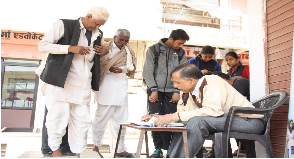
4.5.B Eye Camp by SKIT