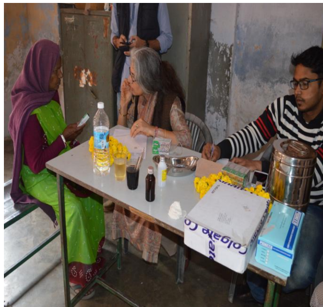
7 (D). Free Medicines Distribution