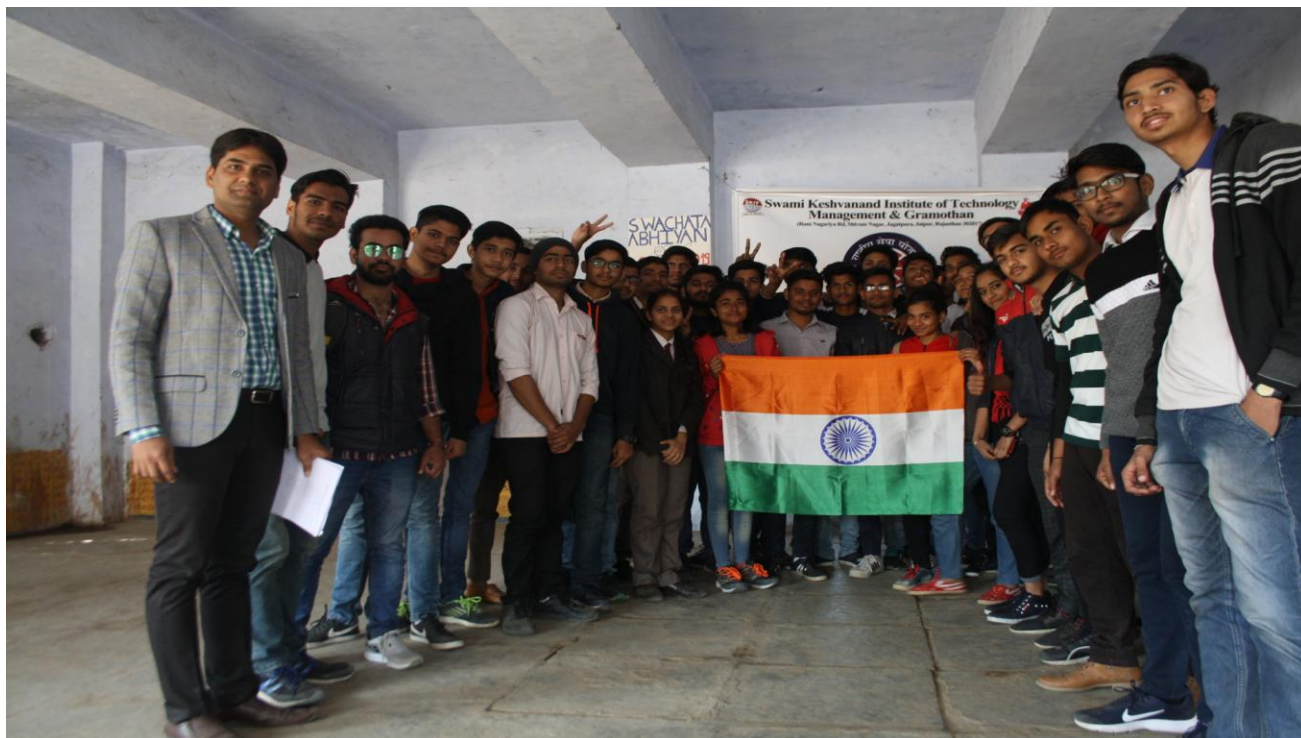
4.1.A During Shradhanjali to Pulwama Attack Soldiers