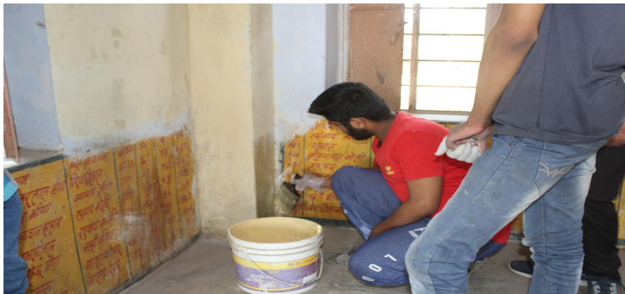
4.3 A Painting of “Yatri Vishram Grah”