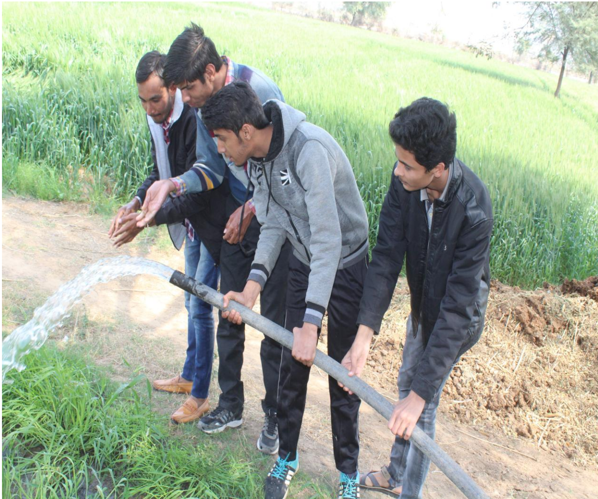
4.6 A Volunteers Work with Irrigation Systems for Improvement