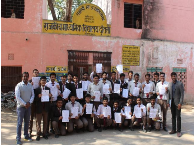
2 (A) Group photo after SBA program

2. Swachh Bharat Abhiyan: Door to door awareness for cleanliness was effectively organized in Dantli village on 15 th January , 2018.