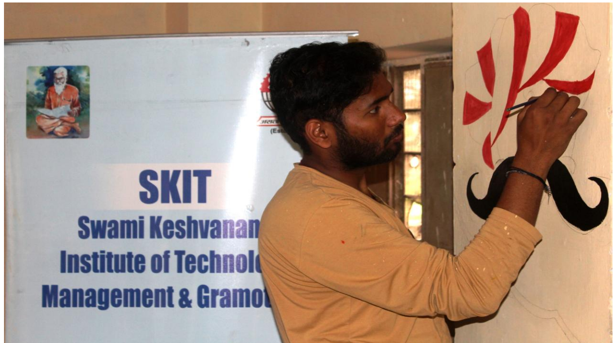
4.4 B Wall Painting and Making Designs