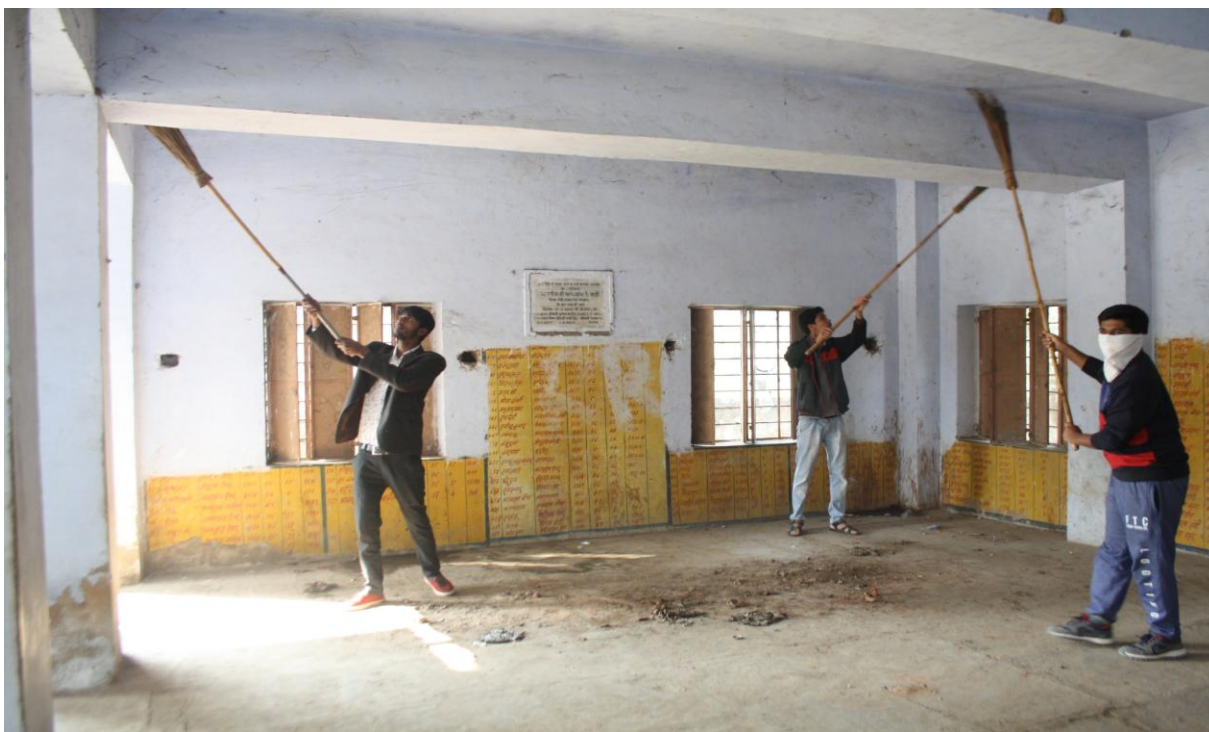
4.1.C Cleaning Drive by Volunteers in Dantli Village