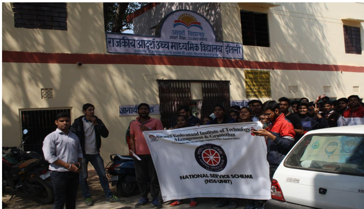
4.1.D Rally for Awareness Regarding “Swachh Bharat Swasth Bharat”