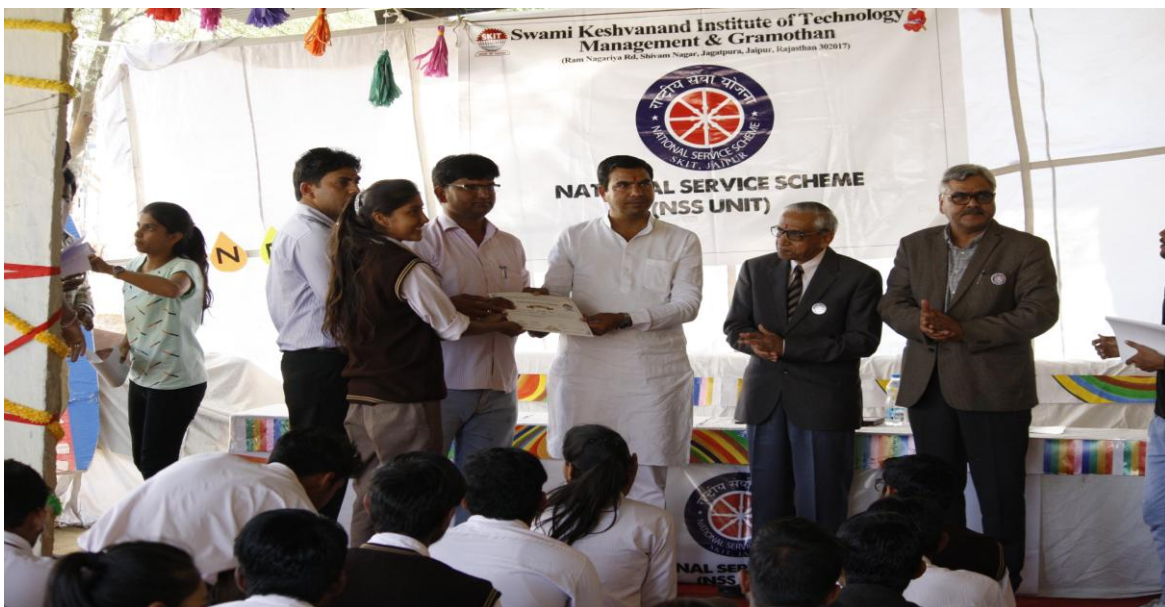
5E. Certificate Distribution Ceremony