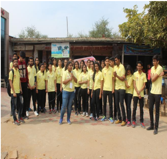
3 (A) Nukked Natak on Save Girl Child

3. Beti Bachao Beti Padhao drive: Organized awareness events by Nukked Natak during 20 th Feb, 2018 to 25 th Feb 2018 with the special reference to the program “Save the Girl Child” Beti Bachao Beti Padhao.