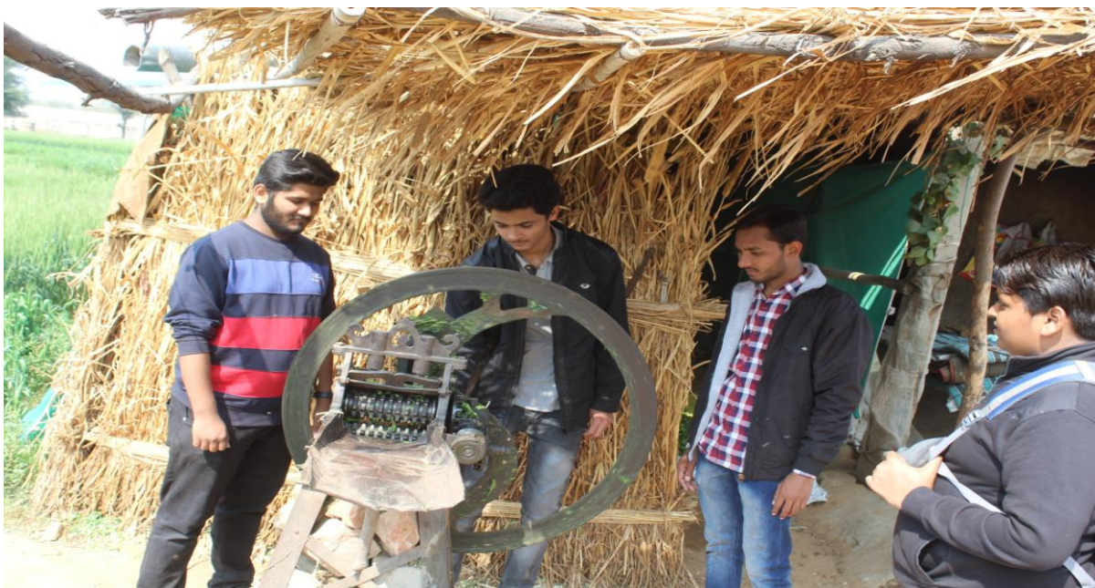
4.6 B Appling New Technology for Farmers