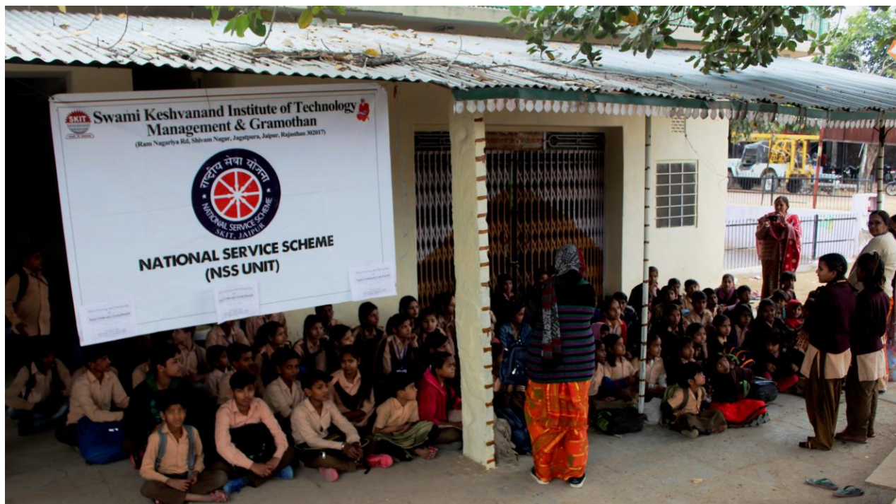
4.4. F Volunteers Interact with Students of Government School on Different Issues.