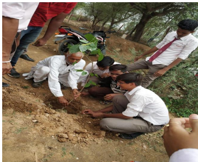
4 (B) Plantation by villagers and