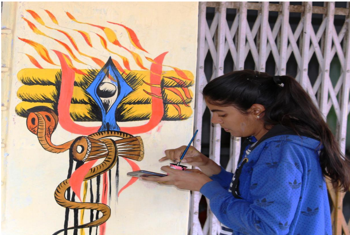
4.4 A Wall Painting and Depicting Designs on the Wall of Temple on the Occasion of Maha Shivratri during Camp