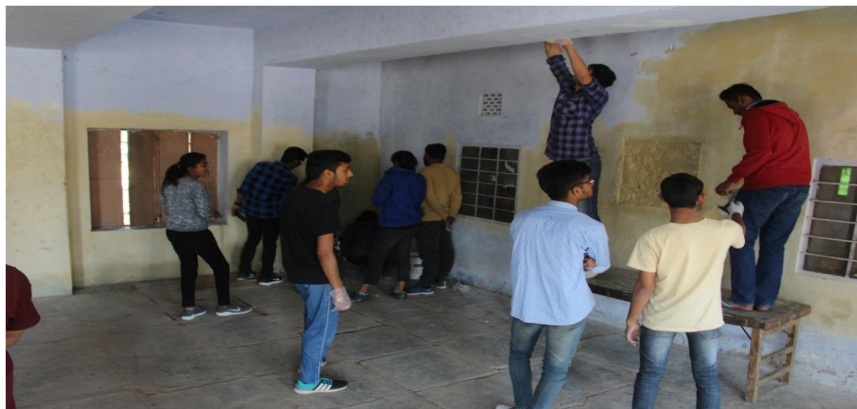
4.3 B Painting of “Yatri Vishram Grah”