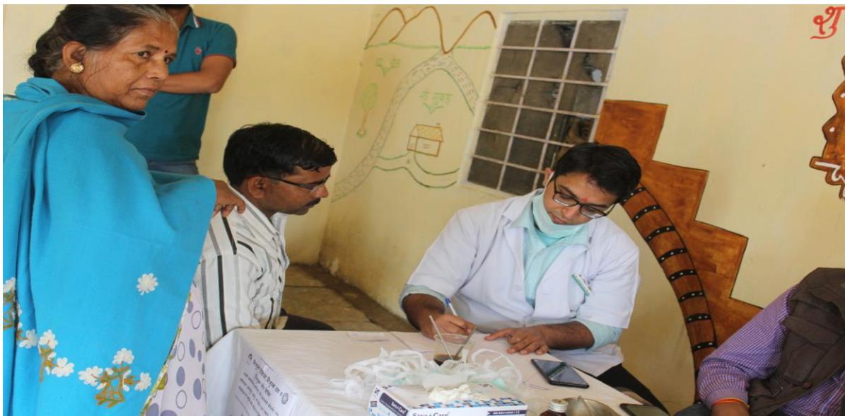
4.7. C Medical Check-up by Doctor in Camp