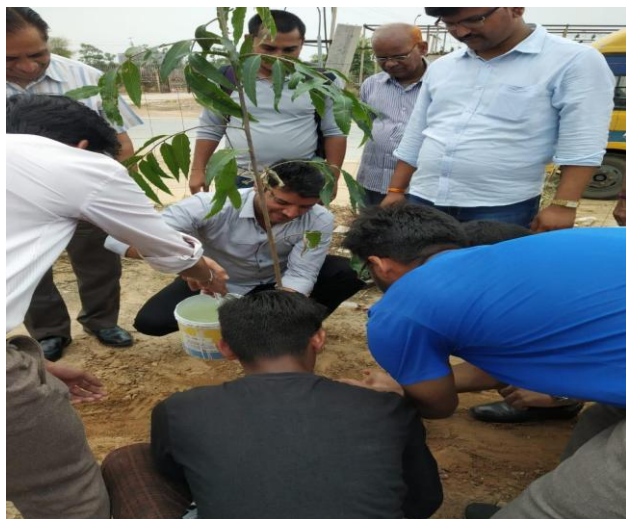
4 (A) Plantation by Director SKIT students

4. Plantation drive: A successful Plantation drive was organized on 11 th July, 2018 in Dantli Village. Different plants such as Neem, Ashok etc were planted at different locations in the village such as Atal Seva Kendra, near Hanuman Temple.