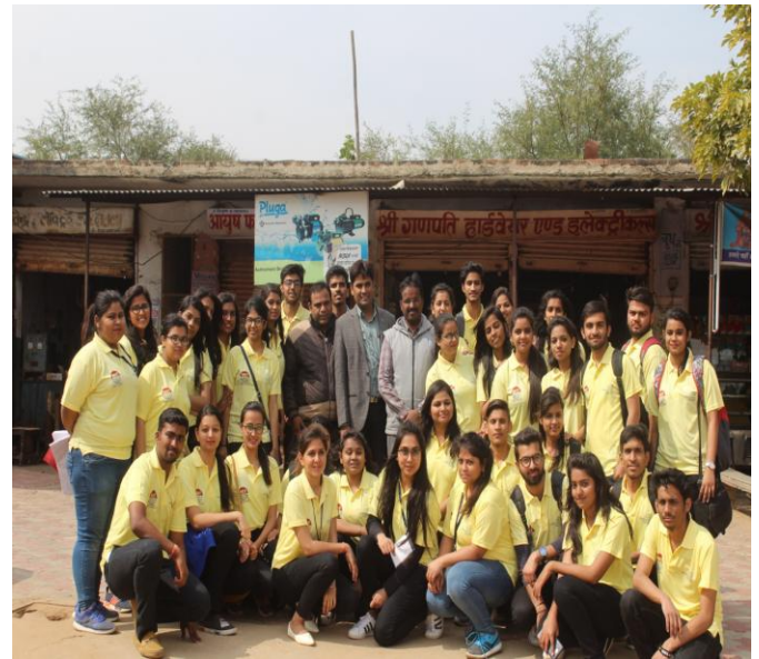
3 (B) Team of Nukked Natak