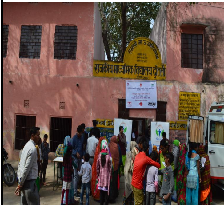
7 (A). Crowd during Medical Camp