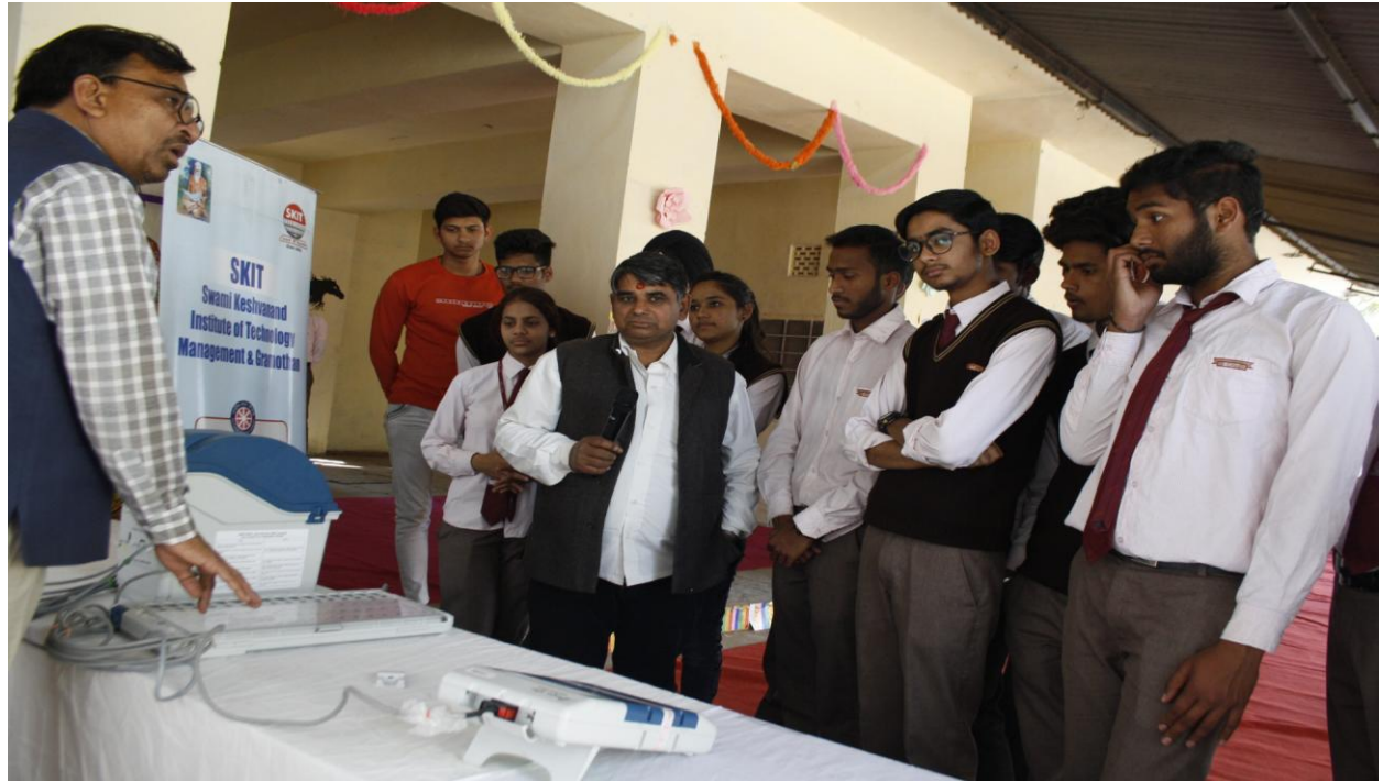
5F. Last activity of Camp EVM Machine Demonstration to Villagers by Student Volunteers