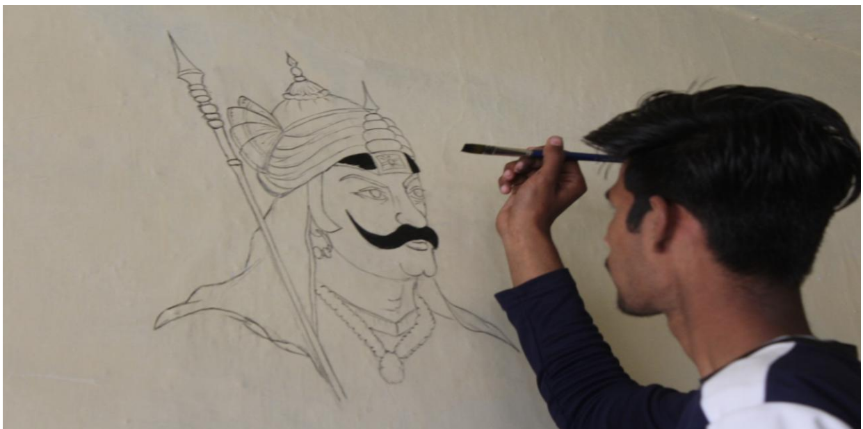
4.3D Sketching the photo of Great Mewad King Maharana Pratap