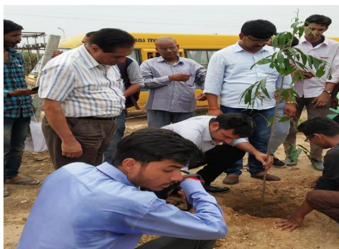
4(D) Plantation with Sarpanch of Dantli