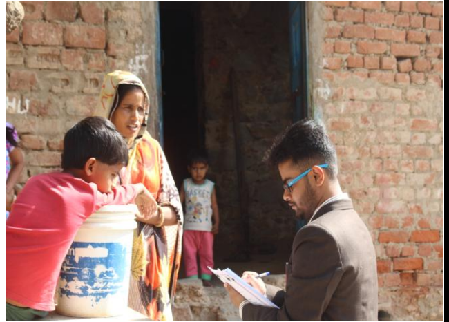
2 (B) Door to Door Awareness

3. Beti Bachao Beti Padhao drive: Organized awareness events by Nukked Natak during 20 th Feb, 2018 to 25 th Feb 2018 with the special reference to the program “Save the Girl Child” Beti Bachao Beti Padhao.