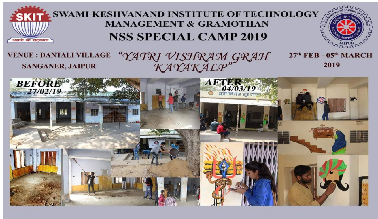
4.4E "Kayakalp" of Yatri Vishram Grah