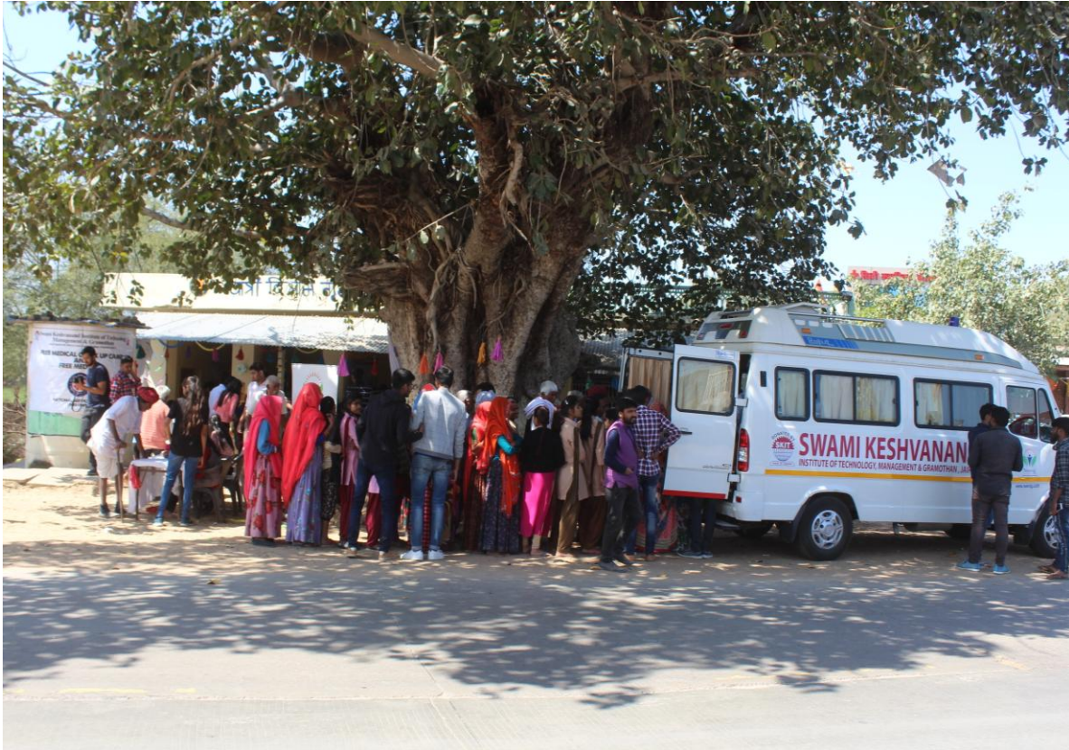
4.7 B Free Distribution of Medicines and Free Check-up by SKIT Medical Van