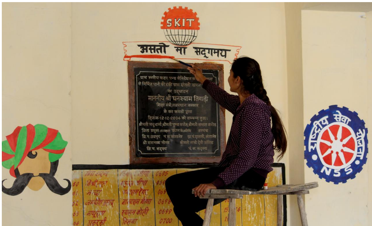
4.3C A Girl Volunteer Making Logo of SKIT during Camp