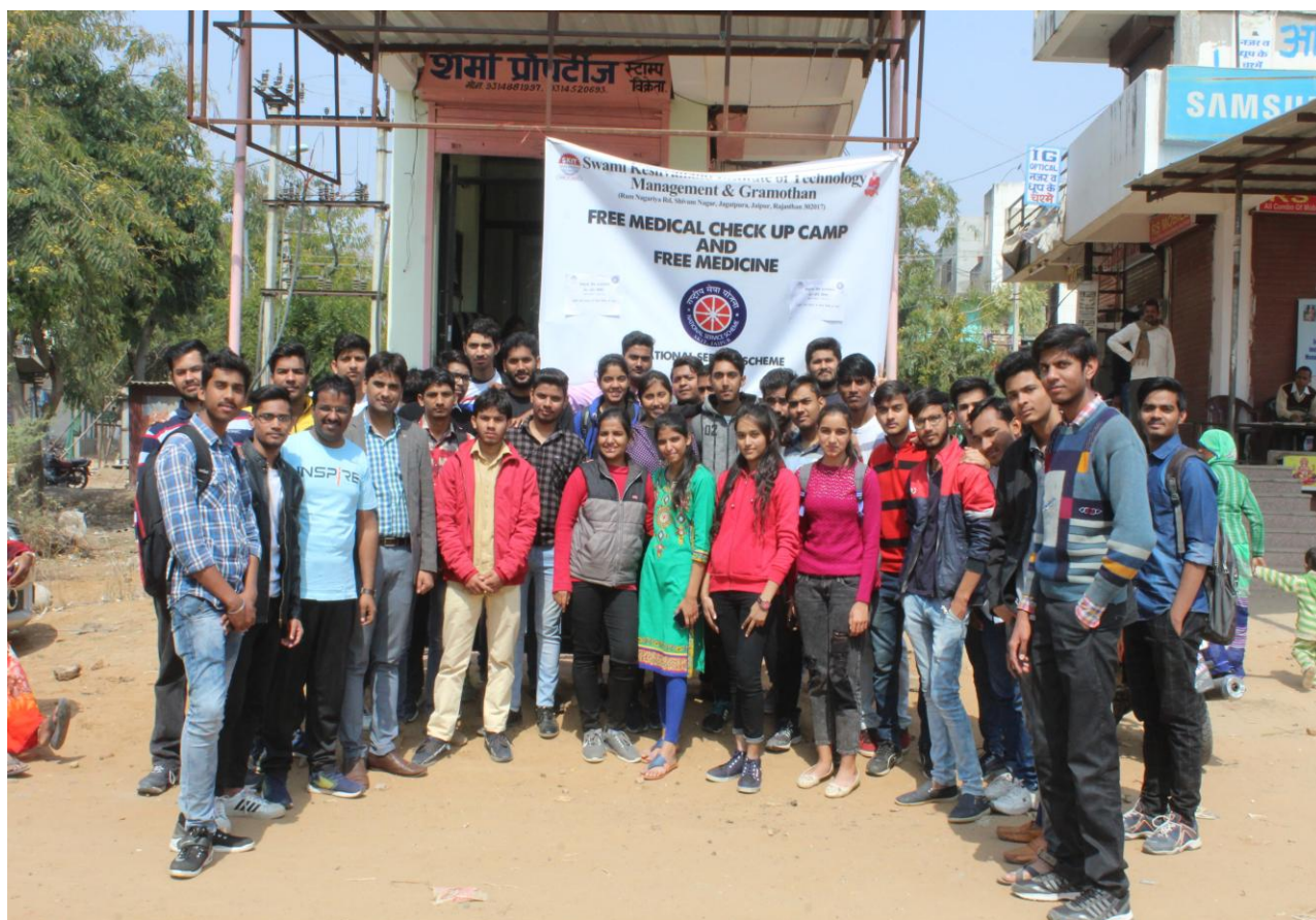
4.5 A Team of Eye Camp