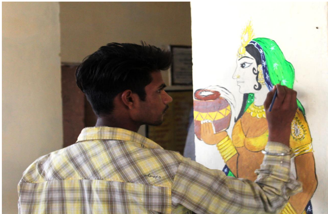
4.4C Wall Painting and Portraying Designs