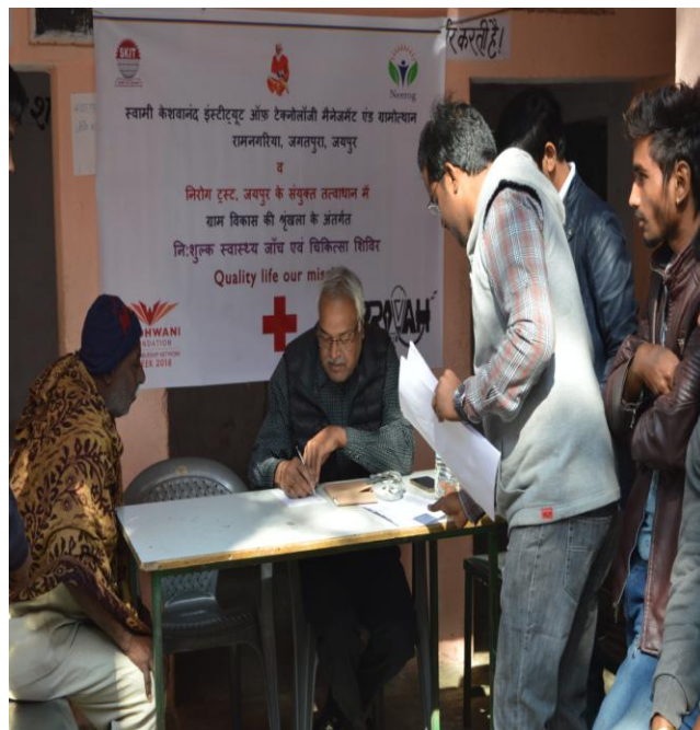
7 (B). Check Up Process during Camp